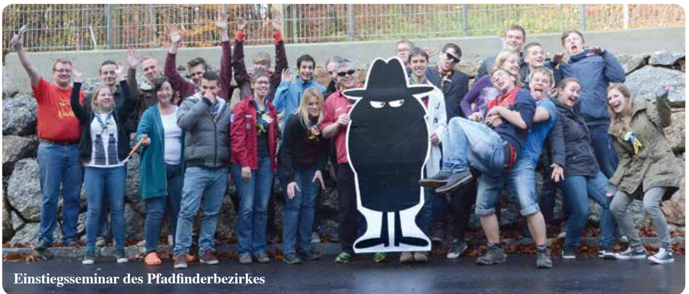
Einstiegsseminar des Pfadfinderbezirkes

Bestandene Bewährungsprobe fürs neue Heim: Am 7./8. November 2015 fand das Einstiegsseminar des Pfadfinderbezirks Yoland in Amstetten statt. 17 Jungführer aus den Gruppen Amstetten, Aschbach, Kematen, Neuhofen, Pöchlarn und Ybbsitz verbrachten gemeinsam ein lustiges und lehrreiches Wochenende.