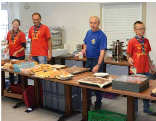
Die „süße“ Crew an der Kaffee- & Kuchen-Theke.