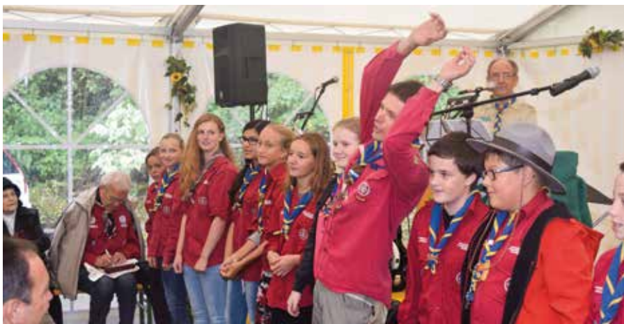
Die Späher und Guides veranstalten den Wotanschuh.