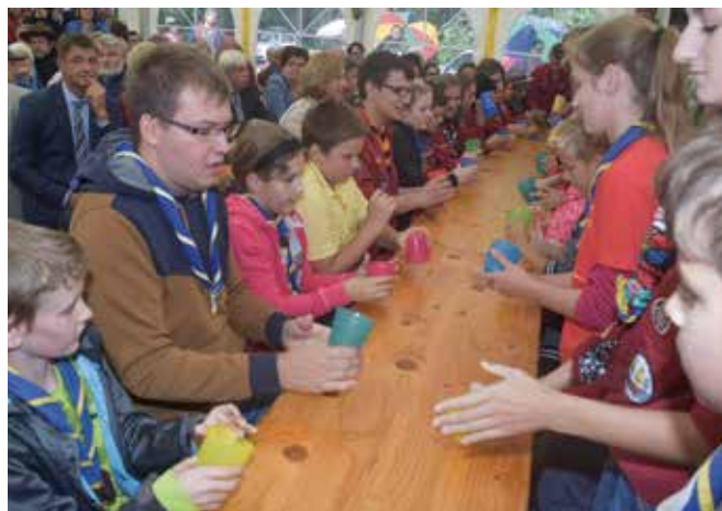
Gemeinsames „Bechern“ der Kinder und Jugendlichen.

Alljene, die ihre „Krawatte“ lieber per E-Mail (als Pdf-Datei) anstatt in gedruckter Form erhalten möchten (und dafür in Farbe), können sich ab sofort unter gf@pfadfinder-amstetten.at für den elektronischen Versand anmelden.