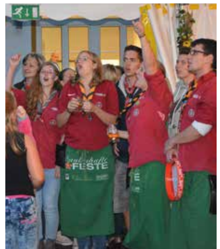
Die Menge tobt.