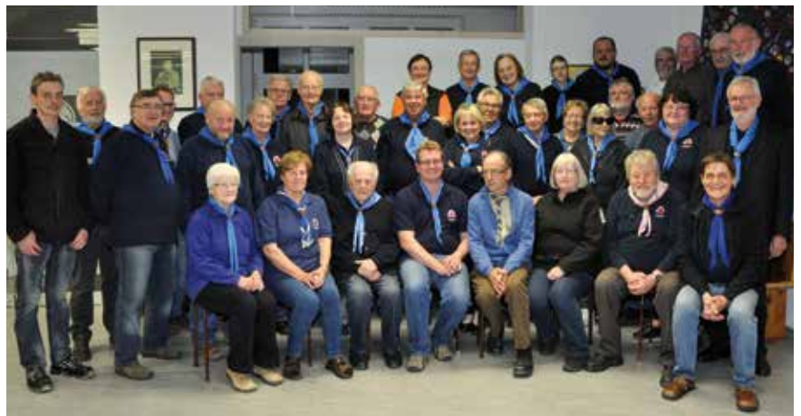
Generalversammlung der Gilde.