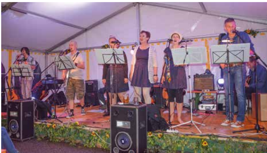
Die Gitarrengruppe der Pfadfinder Amstetten bei ihrem umjubelten Konzert.