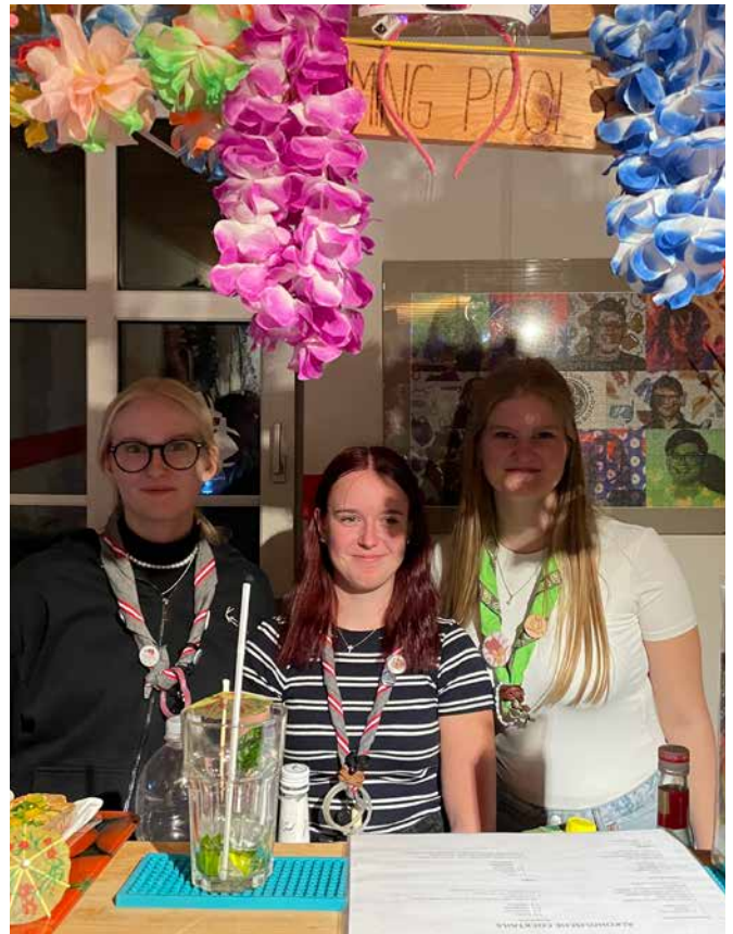
Die Ra/Ro haben vor kurzem ihre StimulierBar wieder eröffnet. Zu Gast waren viele Leiter*innen aus dem Yoland.